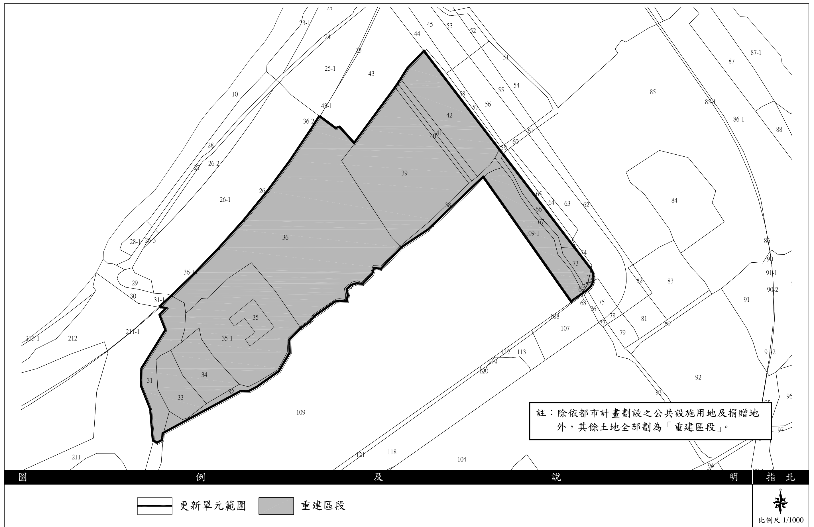
圖 7-2 更新單元區段劃分圖